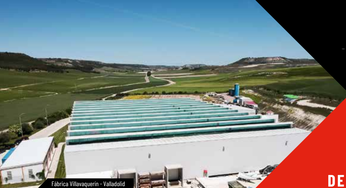
Fábrica Villavaquerín - Valladolid